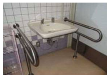
手洗いの高さ 68 cm