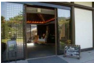
入口幅 170 cm