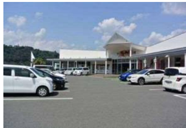
一般駐車場 50 台