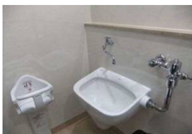
オストメイトあり