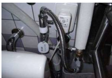
簡易オストメイトあり