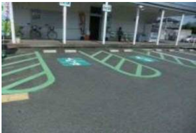
専用駐車場 2 台