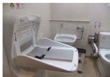
ベビーシート・チェアあり