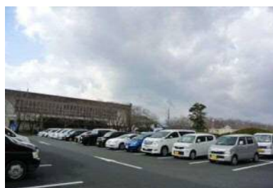
一般駐車場 600 台