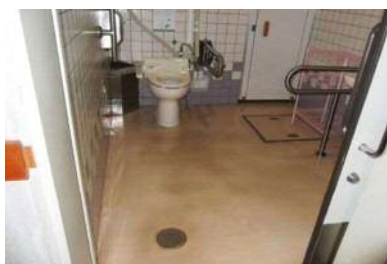
入口幅 65 cm