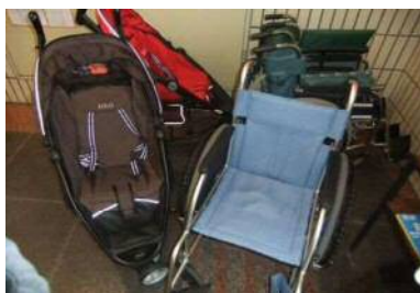
車椅子貸出しあり