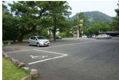
一般駐車場 200 台