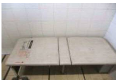
大人用ベッドあり