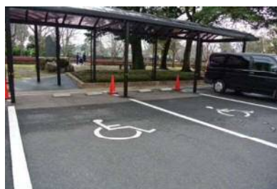
文化会館側 専用駐車場