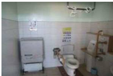
入口幅 96 cm