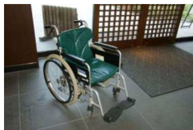
車椅子貸出しあり