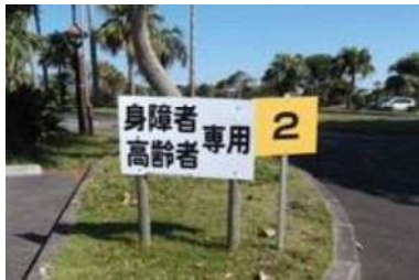
専用駐車場 15 台