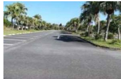
一般駐車場 560 台