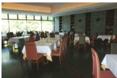
レストランフェニージェ