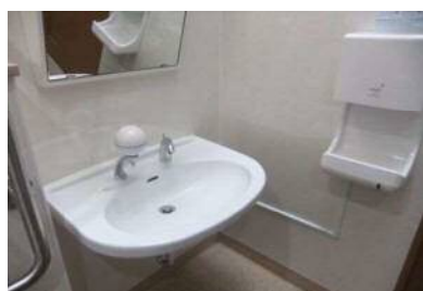
手洗いの高さ 70 cm