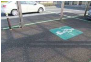
専用駐車場 4 台