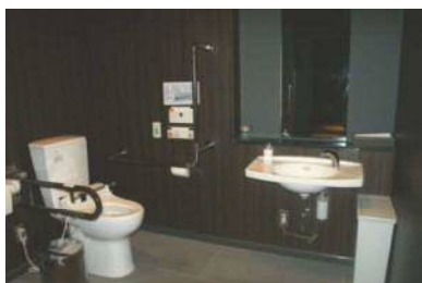
入口幅 90 cm