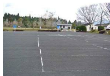
平和会館裏駐車場