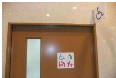
入口幅 85 cm