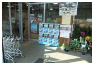
入口幅 77 cm