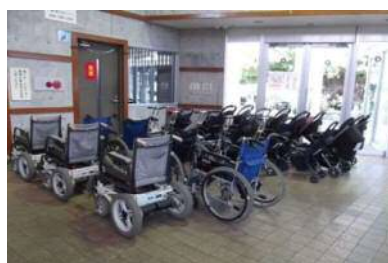
車椅子貸出しあり