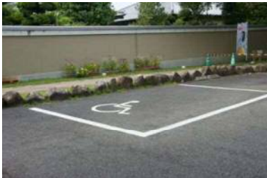
専用駐車場 4 台