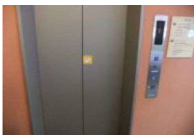
エレベーター入口幅 80 cm