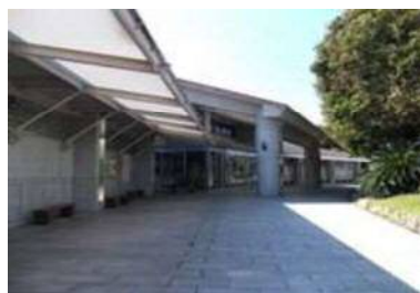
入口幅 145 cm