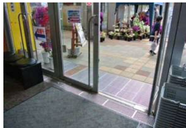
入口幅 180 cm (両扉開放時)