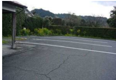
武家屋敷中央駐車場（有料）