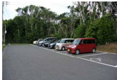
専用駐車場 2 台