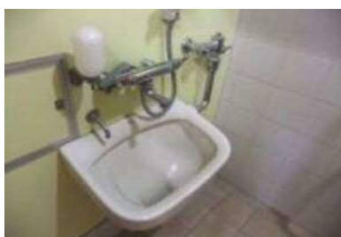
オストメイトあり