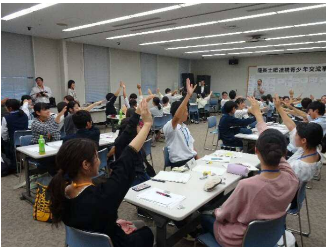
目標の到達度をチェック 手を挙げる角度で自分の到達度を表示