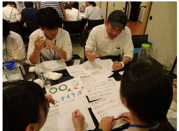
講師の先生から資料作成や効果的なプレゼンの方法について助言を仰ぐ