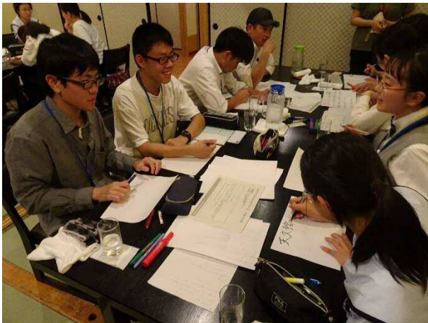
翌日のプレゼンに向け資料作成