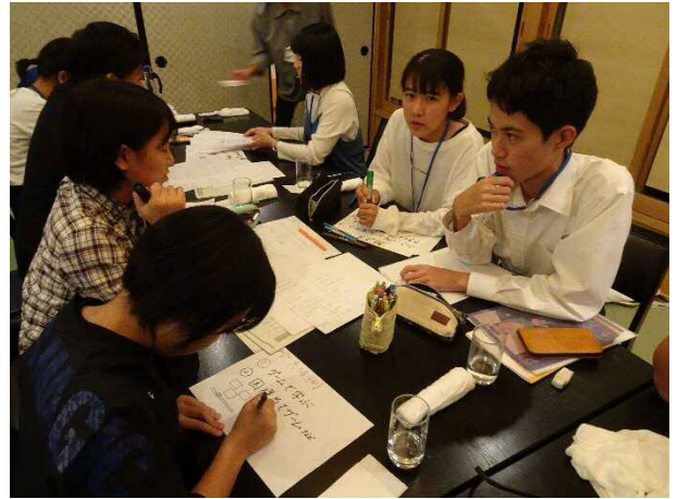
翌日の発表会に向けプレゼン資料作成