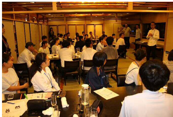
翌日の発表会に向けて各講師陣からのアドバイスとメッセージ