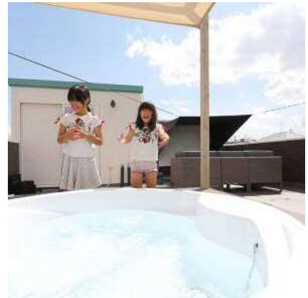
(株)シースタイルの住宅イメージ