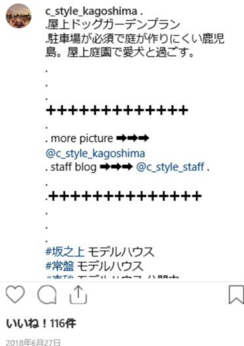
屋上付き木造住宅の様子