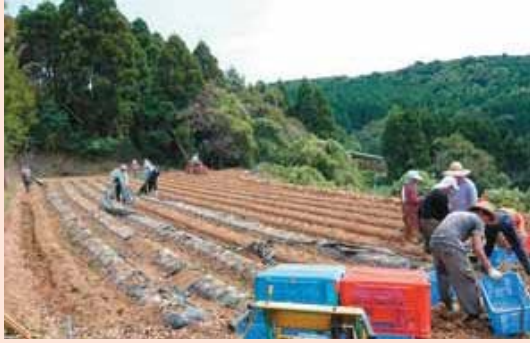
耕耘機の導入で作業効率がアップ。収穫量の増加で収入も増えたという