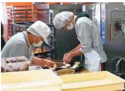
平尾幼稚園跡に開所した「ぼんぼこ村」の第2作業所。ここにパン工房もオープンした