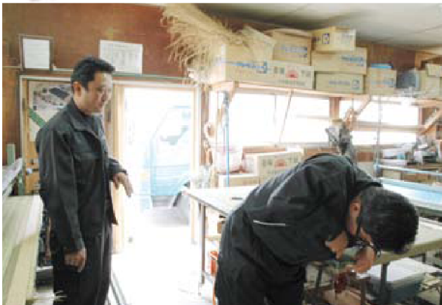
畳の角綴じをするOさん