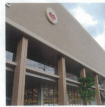
きりしま国分山形屋正面

住所 〒899-4332 鹿児島県霧島市国分中央3丁目7番17号 TEL 0995(45)1511 FAX 0995(45)1513 営業時間 10:00~20:00 年内無休