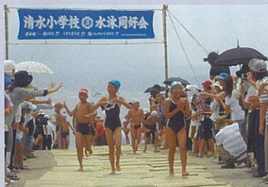
錦江湾横断遠泳に挑戦できるのは、4年生から。初挑戦は白、2回目は青、3回目はオレンジ色の帽子をかぶり、桜島の小池海岸から、磯海水浴場までの4.2キロを泳ぐ

来年はいよいよオレンジ帽。3年連続完泳の盾をもらえるようにがんばりたい。そして、一人でも多くの方が「聞こえないってどういうこと?」と考えてくれるように願っている。