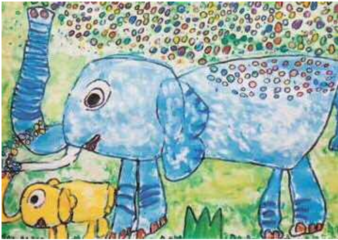
ぞうのおやこの水あそび ふじさき ちあき 藤崎 千晶さん