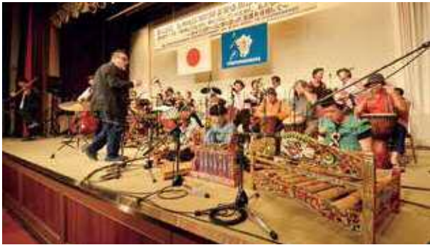
演者と聴衆との間に心地よい一体感をもたらすパフォーマンス