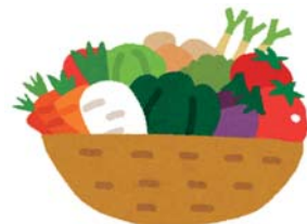
令和4年度 食品衛生法及び食品表示法に基づく自主回収状況 (鹿児島市は除く)