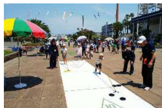
〔ニュースポーツ体験：シャッフルボード〕

各種競技団体やコミュニティスポーツクラブによるスポーツ体験教室や交歓試合、ニュースポーツ体験などを行い、参加者は、それぞれにさわやかな汗を流されました。