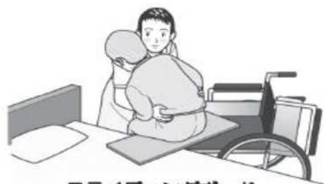
スライディングボード