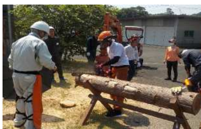
(2-③：鹿児島きこり塾（技術研修）)