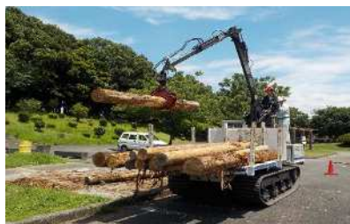
(2-⑤：技能講習・特別教育)