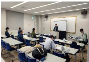
(地域林政アドバイザー研修)