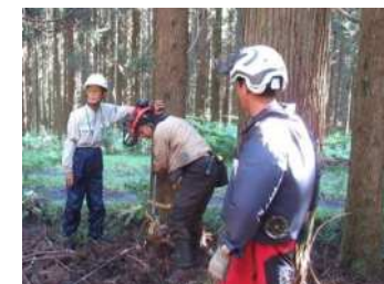
(3-③：作業システム改善指導)