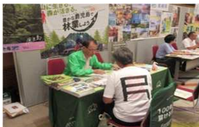
(1-①：UIターン者の就業促進活動)