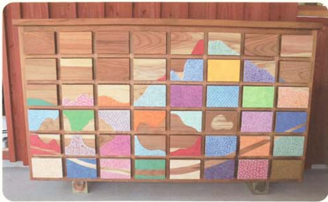
幼稚园的小收纳箱