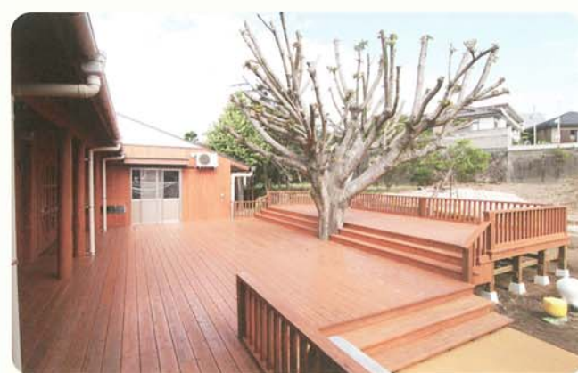
保育园的木质露台