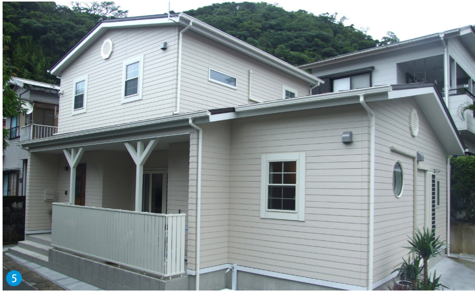
5 白を基調にまとめた外観は、シンプルなか中に明るさや爽やかさを感じます