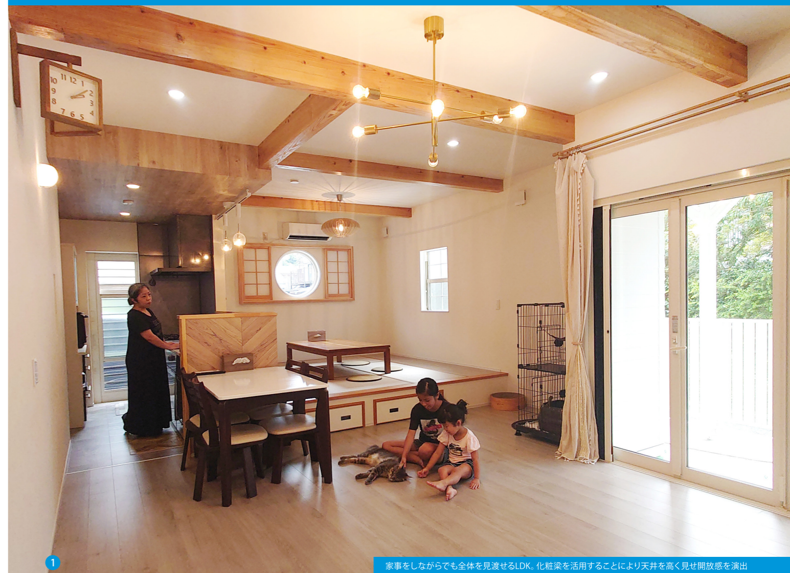
1 家事をしながらも全体を見渡せるLDK。化粧梁を活用することにより天井を高く見せ開放感を演出