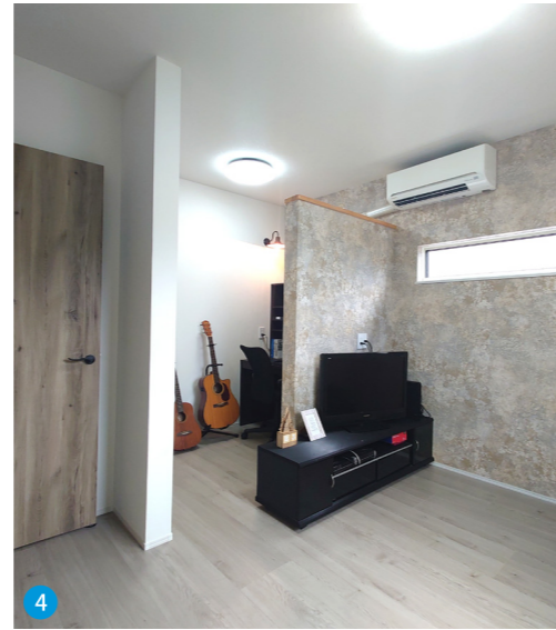
4 多忙なご主人のために、在宅ワークができるように寝室内に独立したワークスペースを設けました