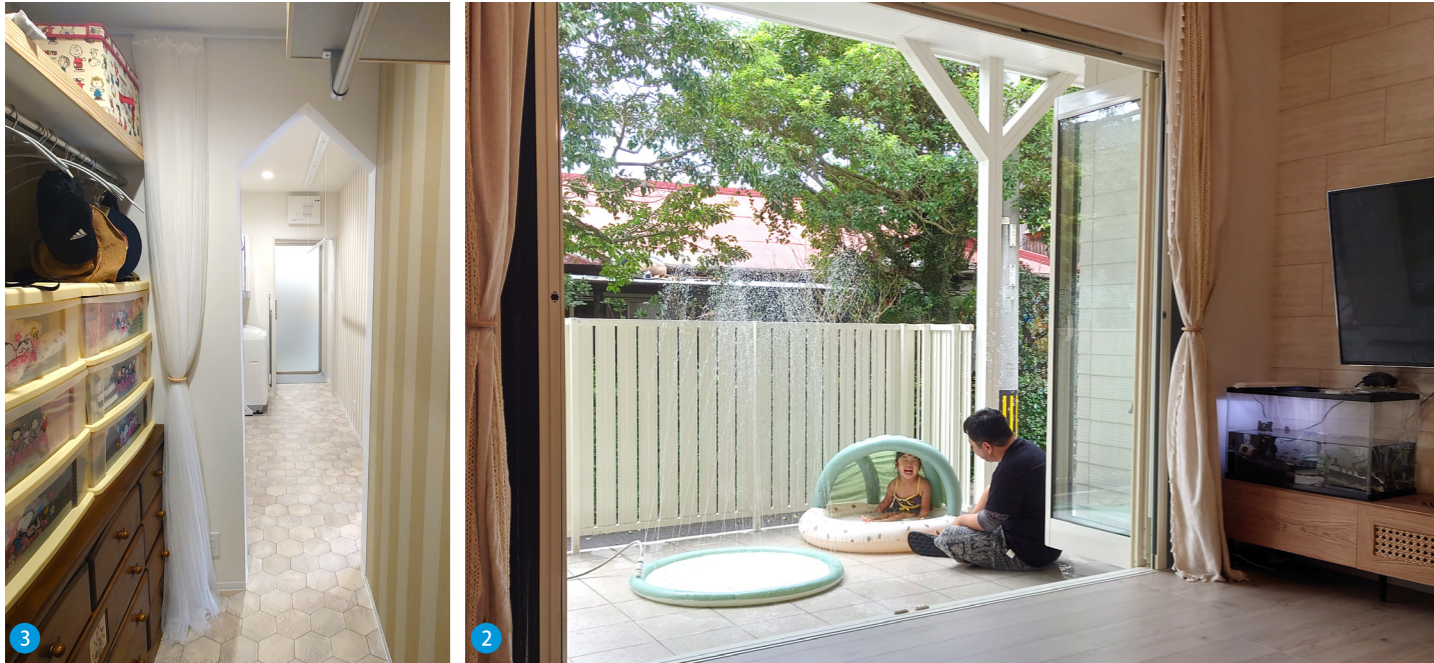
3 リビング横に配置した「洗う・干す・しまう」の家事ラク動線 2 掃き出し窓は開放感のあるオープンウィン。その先は子どもたちがのびのびと遊べるタイルデッキ