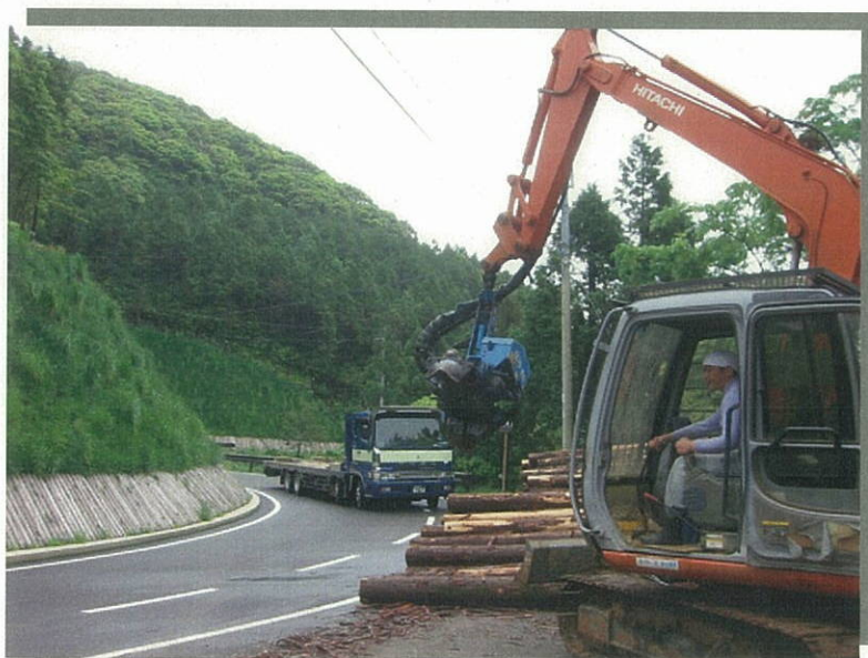
森林管理道 鳥越線 (内地:南九州市)