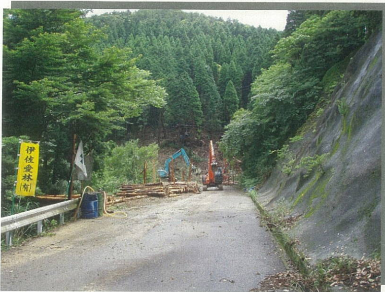
森林基幹道 紫尾線 (内地:薩摩川内市~阿久根市 ~出水市~さつま町)

○林道は、森林の適切な整備や、木材の搬出等、効率的な林業経営に重要な役割を果たしています。