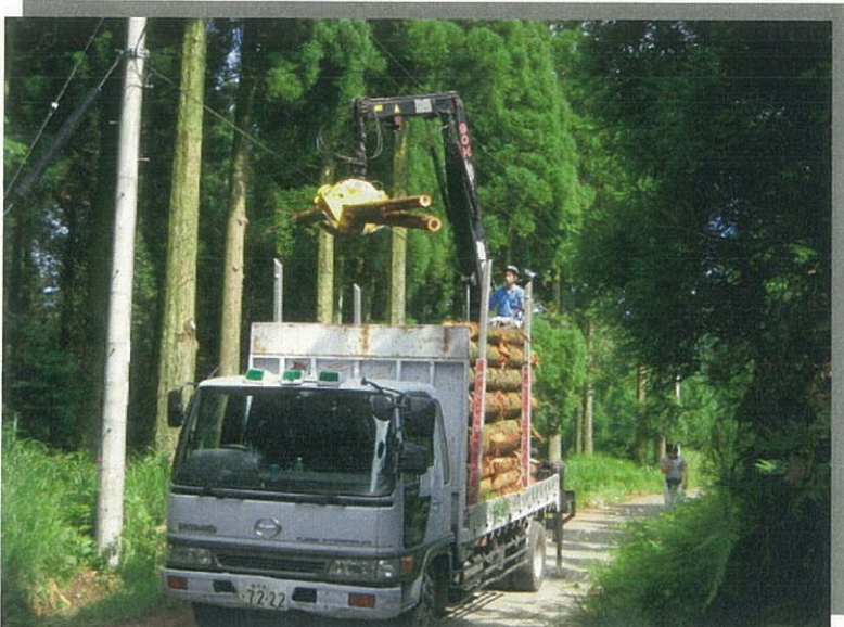
森林管理道 八尻線 (内地:南九州市)