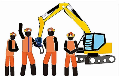
機械の管理者を決める