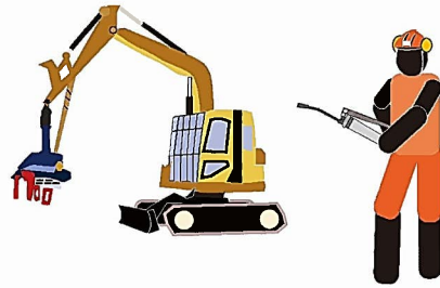
始業前点検、グリスアップ