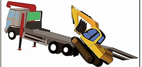
積み降ろし転落注意