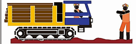
危険箇所は誘導員指示