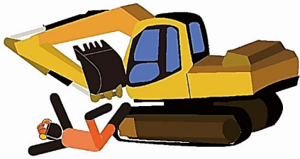
乗り降り時の転落注意