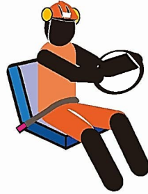
ヘルメット・シートベルト