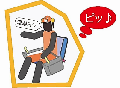
動作前ホーンで合図