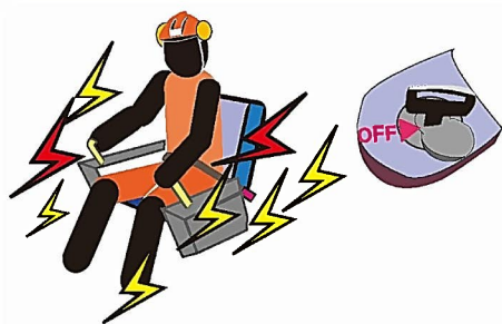
異常な騒音振動運転停止