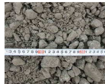
製品 再生碎石 RC-40