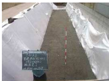
・石垣・擁壁の裏込め材