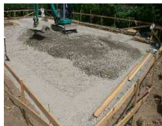
・建築物の基礎材