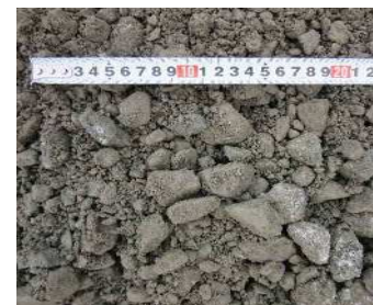
製品 再生碎石 RC-30