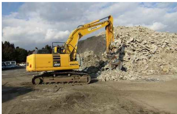
小割 ・マグネットで鉄筋の 除去 ・異物の除去