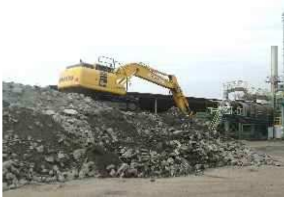
バックホウにて混合 コン殻90%・アス殻10%