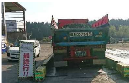
AS塊及びコン塊 処分受入