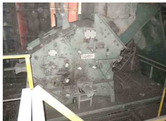
インパクトクラッシャー にて材料を破碎