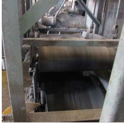
磁選機 ② (鉄筋除去)