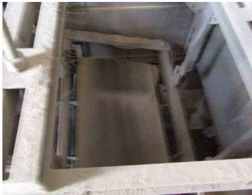
磁選機 ③ (鉄筋除去)