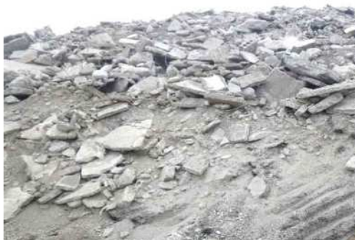
コンクリート塊ス tock状況