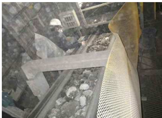
人手による異物の除去