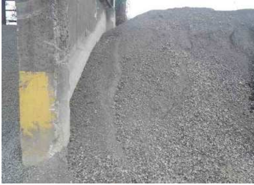
R C -40 製品置場