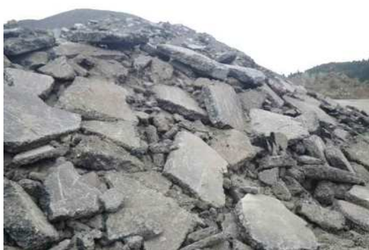
アスファルト塊ストック状 況