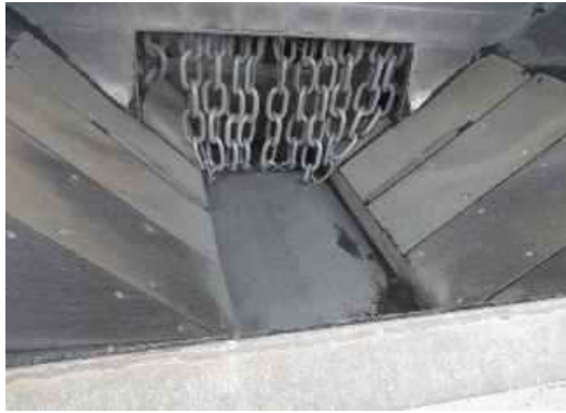
ジョークラッシャーで 破碎