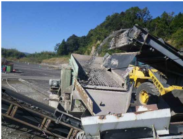
試料ふるいによる分別