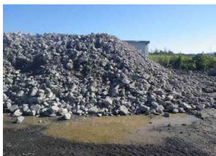
コンクリート塊ストック状況