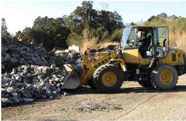
ホイールローダーによる コンクリートと アスファルトの混合 Co : As = 9 : 1