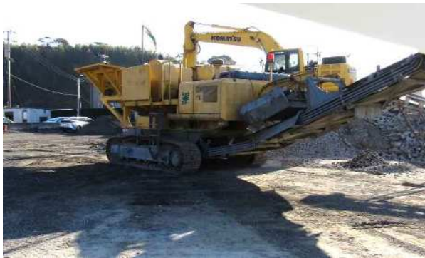
バックホウによる ガラパ Gos 投入状況