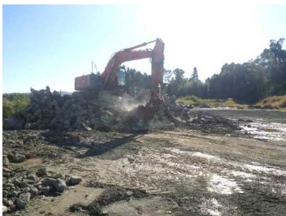
油圧ショベル・小割機による コンクリート塊を小割 マグネットで鉄筋等の除去