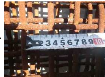
網の目 30mm × 30mm