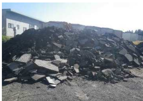
アスファルト塊ストック状況