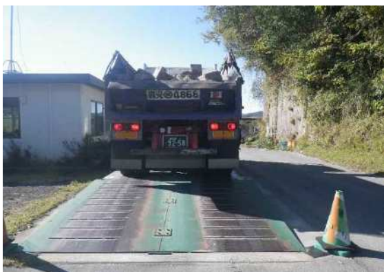
AS塊及びコン塊 処分受入