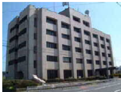
県環境保健センター（城南庁舎）