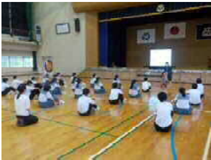
環境教育授業（環境月間）