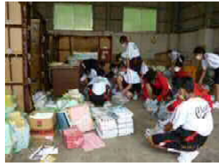
こどもエコクラブ