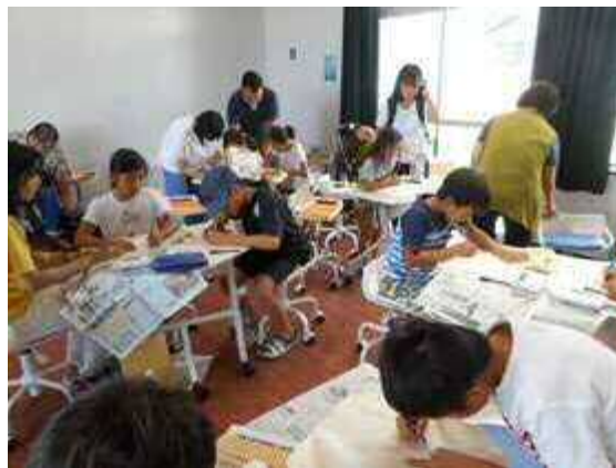
ワークショップ（エコバックづくり）