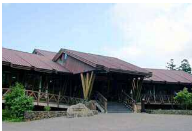
屋久島環境文化研修センター