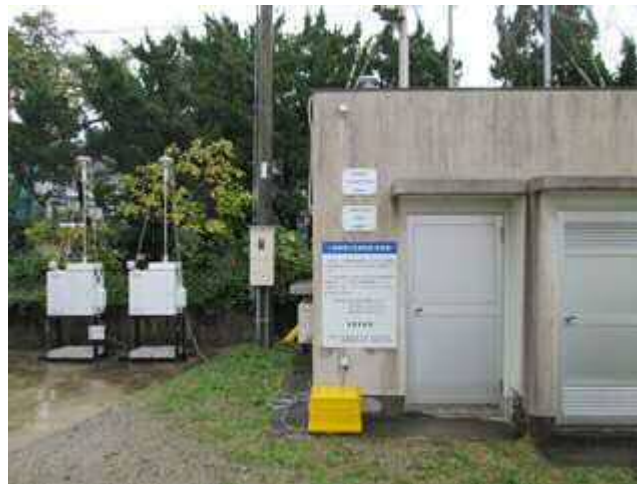
大気測定局と微小粒子状物質（PM 2.5 ）の成分分析用サンプル