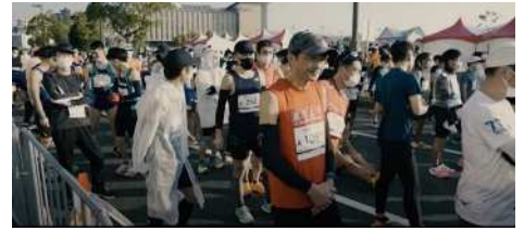
(鹿児島マラソン2023ダイジェストムービーより)