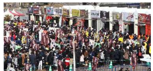
(鹿児島ラーメン王決定戦企画書(KTS, 西原商会)より)