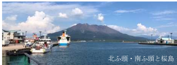
北ふ頭・南ふ頭と桜島