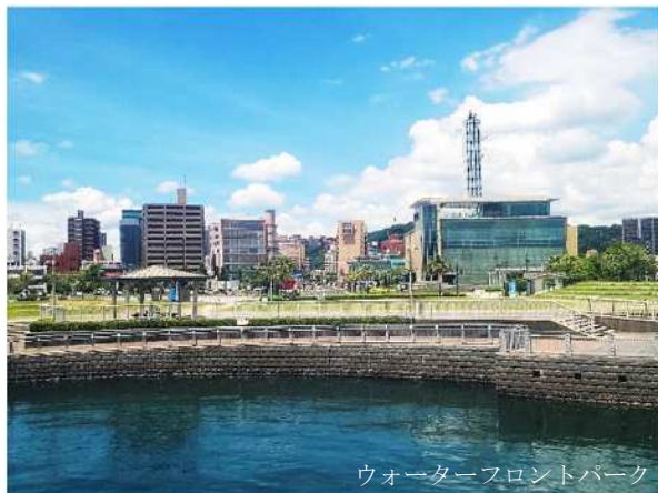
ウォーターフロントパーク