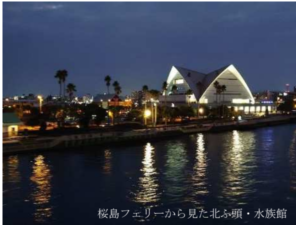
桜島フェリーから見た北ふ頭・水族館