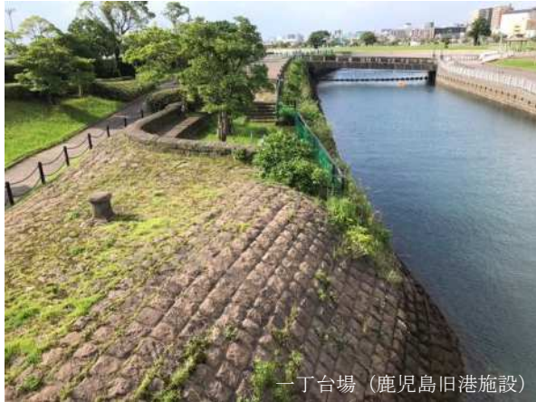
一丁台場 (鹿児島旧港施設)