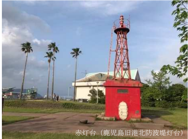
赤灯台 (鹿児島旧港北防波堤灯台)