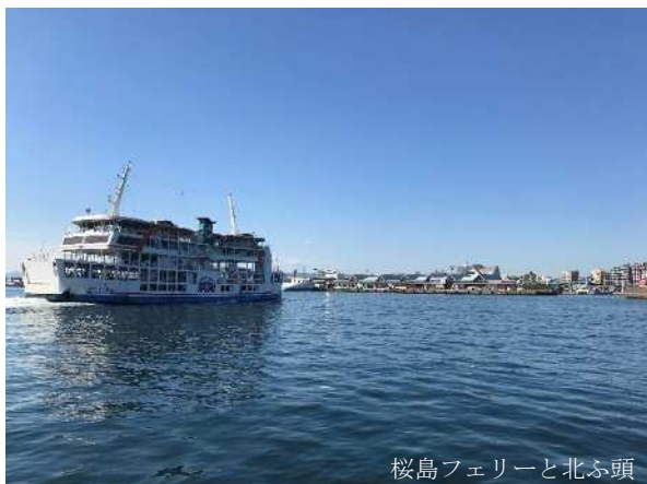
桜島フェリーと北ふ頭