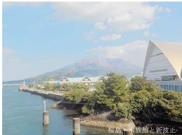
桜島・水族館と新波止