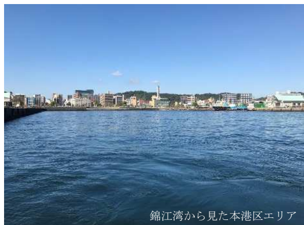
錦江湾から見た本港区エリア