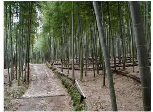
改良竹林（路網開設）