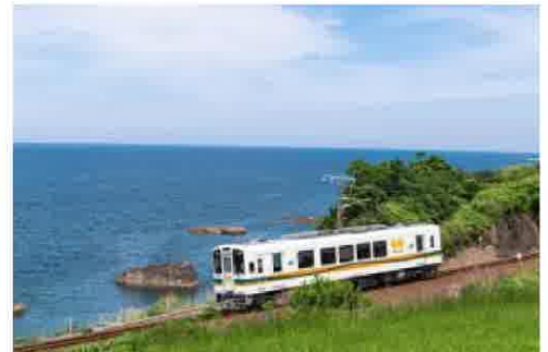
肥薩おれんじ鉄道