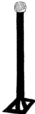
標ノ図高サ 騎馬ノ長サ ナリ

十六騎ツ、双方ニ分レ、各一騎ツ、乗出シ、場中ニテ 太刀打、或ハ図ノ如ク馬筋ヲ乗切、第一・第二ノ標短 銃ニテ二発シ、直チニ竹刀ヲ拔持チ、第三・第四ノ標 切捨突刺事ヲ修練仕候、何レモ駈計ヲ乗申候、人馬共 渾者成事、甚愉快ニ御座候、 第八大備ヲ繰ス、五十六騎