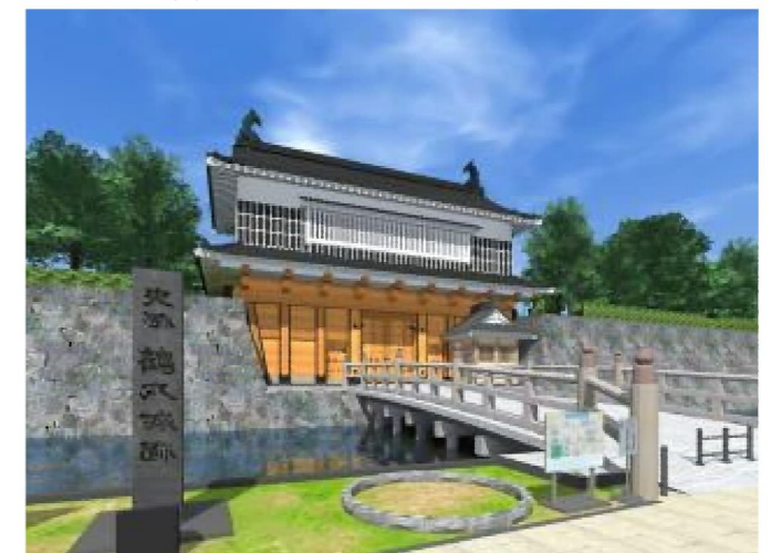
御楼門完成イメージ図