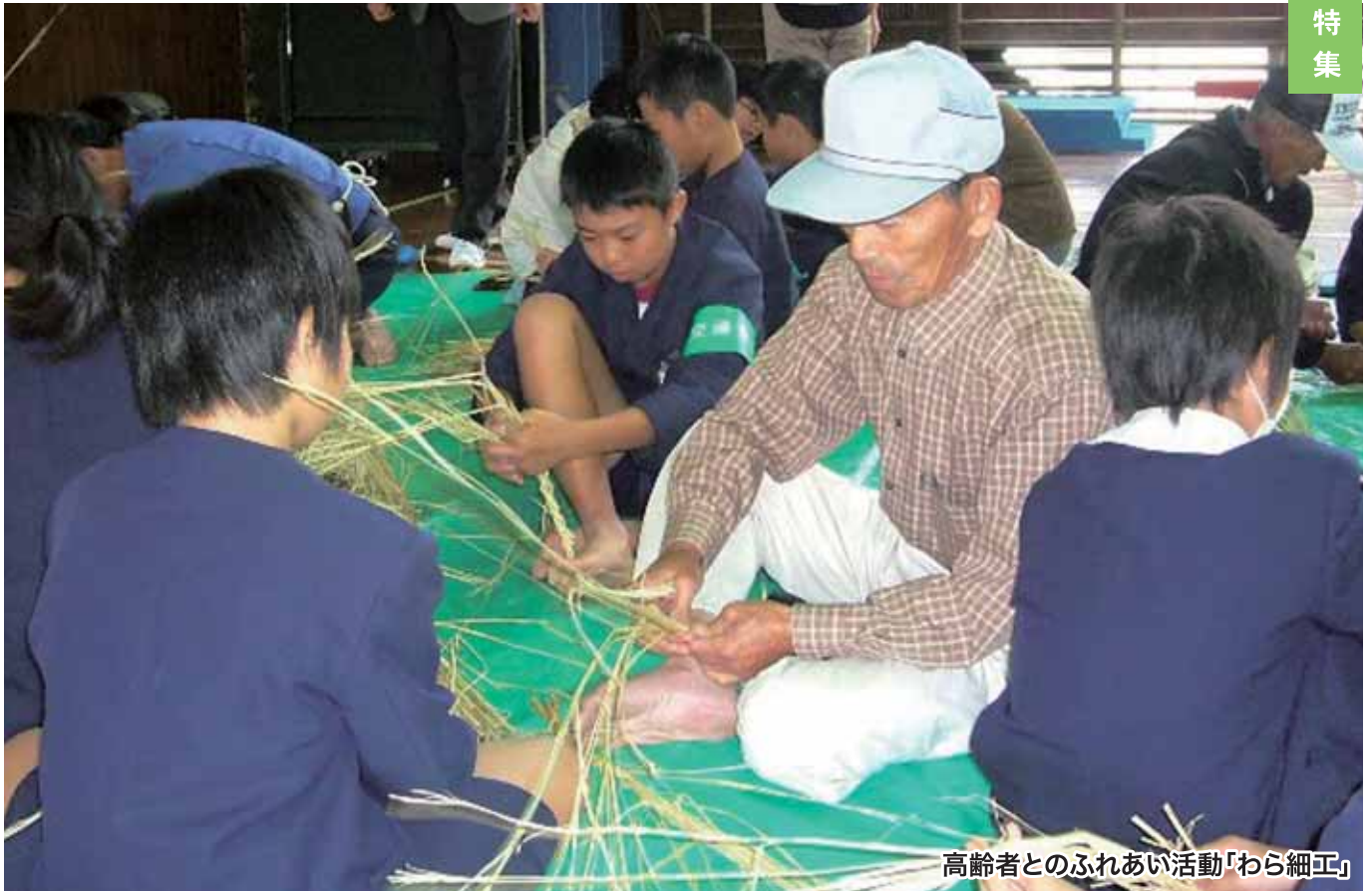
高齢者とのふれあい活動「わら細工」