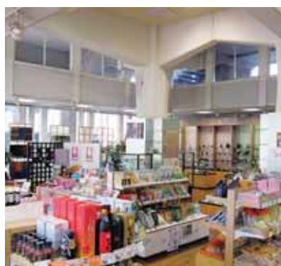
「県産品総合展示販売場」「鹿児島ブランドショップ」(県産業会館1階)