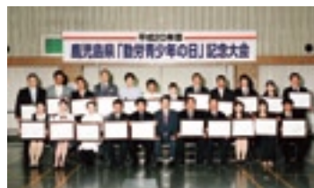
平成20年度優良勤労青少年表彰者

県では、県内の青少年の模範となる個人および団体を優良勤労青少年として表彰しております。