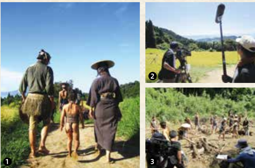
① ② 霧島市でのロケの様子 灼熱の太陽が照りつける厳しい暑さの中でのロケでしたが、撮影は順調に進みました ③ 日置市でのロケの様子 慣れない草履や衣装に身を包みながらも、声を上げながら楽しそうに参加された地元エキストラの皆さん