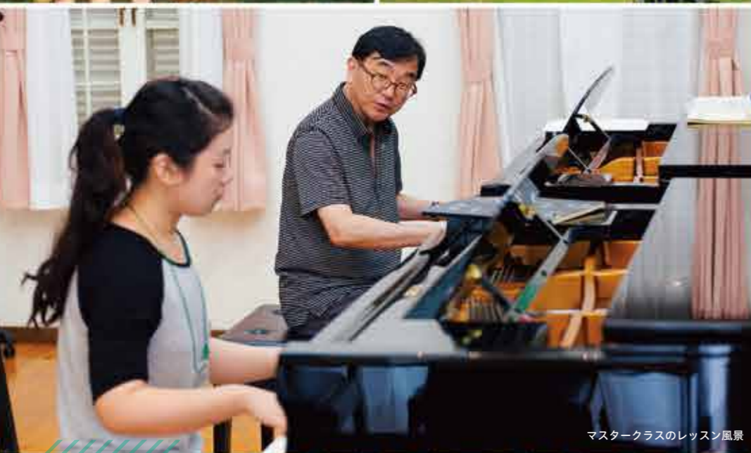
マスタークラスのレッスン風景