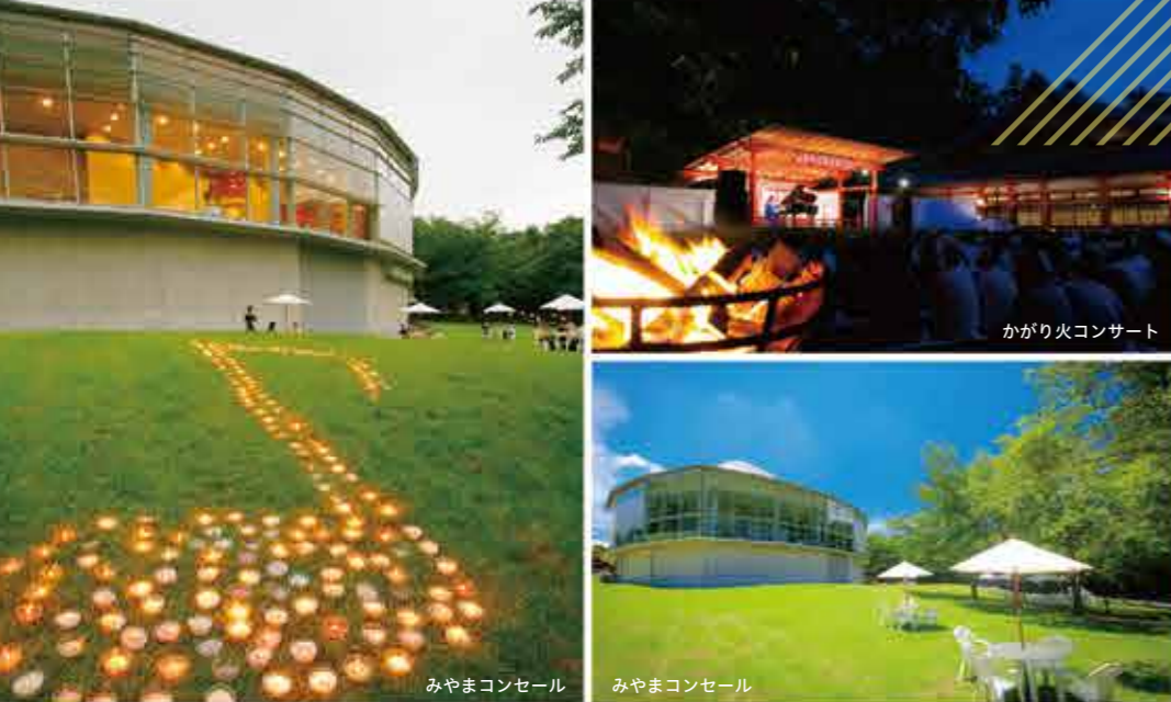
みやまコンセール