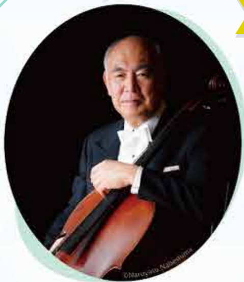
音楽監督 堤 剛 Tsuyoshi Tsutsumi