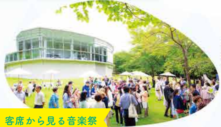
客席から見る音楽祭