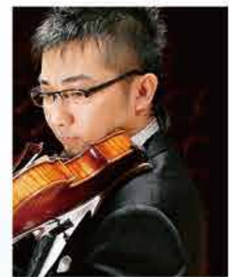
読賣日本交響楽団 コンサートマスター

受講生として参加したのは、確か、みやまコンセールが完成した年でした。音楽祭の環境が飛躍的によりよくなり、皆がとても喜んでいました。レッスンで学んだ、作品の背景から作曲家が何を考えているのかを考え、その上で演奏するという姿勢が、今も自分の中に生きています。 また、演奏会がたくさん行われていたの、いろいろな聴きに行つて、そこから沢山の刺激をもらいました。先生方の演奏に感動したのを覚えています。 参加者は互いに親近感があり、友達はもちろん、プロのすごい演奏家たちとも触れ合うことができて、とても貴重な経験となりました。