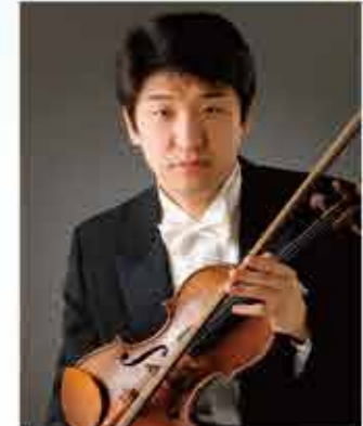
NHK交響楽団 コンサートマスター