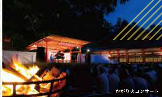
かがり火コンサート