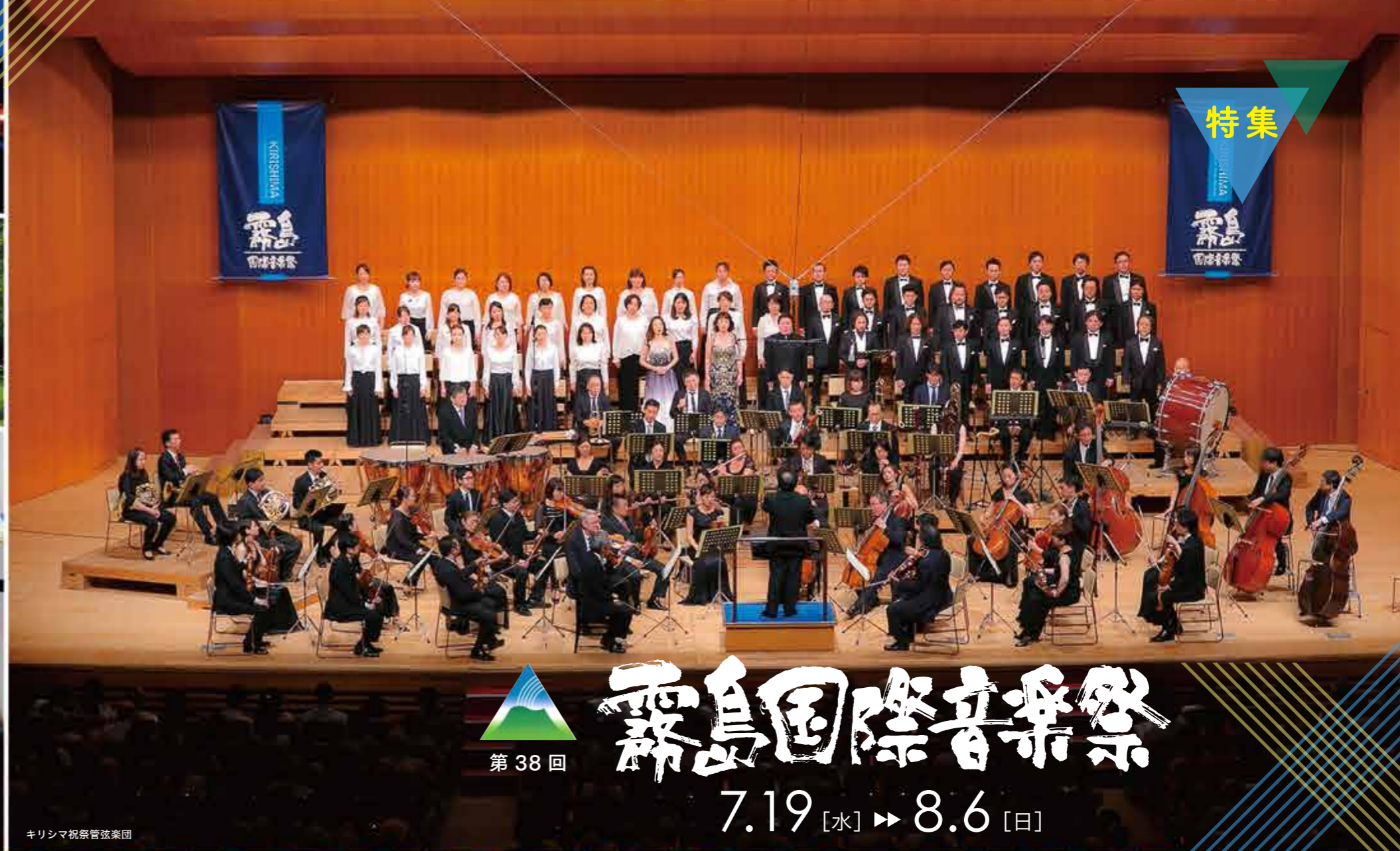
クリスマス祝祭管弦楽団