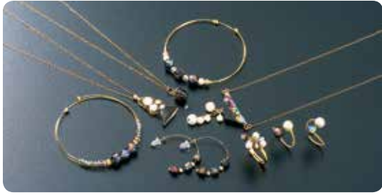
—火山灰アクセサリ— tephra (テフラ)

【商品サイズ】ネックレス:チェーン40cm・チャーム3cm×4cm、ピアス:1cm×6cm、 プレスレット:直径5cm 【原材料】桜島の火山灰・樹脂・チェーン(14kgf)・ホログラム・コットンパールなど 【価格】2,500円～8,000円(税込)