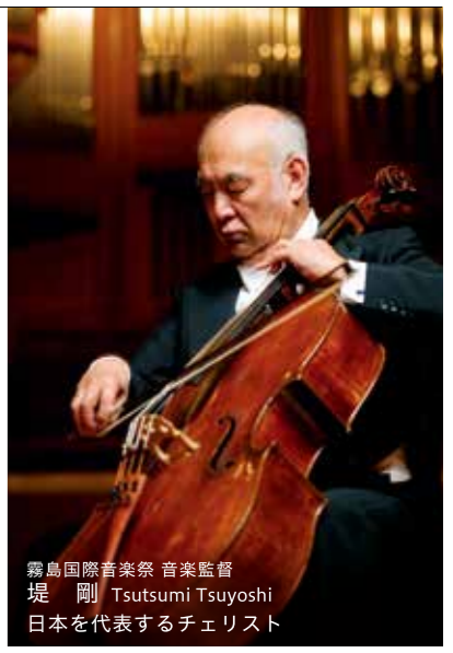
霧島国際音楽祭 音楽監督 堤 剛 Tsutsumi Tsuyoshi 日本を代表するチェリスト

霧島国際音楽ホール(みやまコンセール) ■住所: 霧島市牧園町高千穂 3311-29 ■問い合わせ: 0995(78)8000