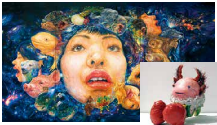
「顔の惑星〜リンカーションIII〜」2016 © Erina MATSUI 「ウーパンチングマシーン」2009 © Erina MATSUI, courtesy of YAMAMOTO GENDAI

松井えり菜は、強烈なインパクトを与える個性的な自画像で知られている画家です。「循環」をコンセプトとした松井の創り出す顔だらけの世界には、次々に生まれ変わる「わたし」が待ち受けていて、一人の魂がリサイクルされながら創造される宇宙を体感することになるでしょう。 九州で初めてとなる展覧会！松井の創り出す顔の惑星を、ぜひお楽しみください。