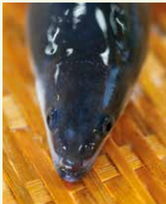
表紙写真 大隅養まん漁業協同組合産のウナギ (鹿屋市)

ツルツとして肉厚、艶のある身体と、つぶらな瞳。大隅産ウナギは生産量日本一で、これからが繁忙期。全国へと出荷されます。