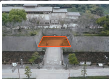
[ 御楼門建設予定地 ]

火災で消失する前の明治初期に撮影された写真や、残されていた礎石の痕跡から、主柱や脇柱などの大きさが判明しており、類似例や文献資料などを参考に建設することとしています。