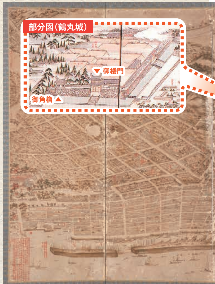
【天保年間鹿児島城下絵図(鹿児島市立美術館蔵)】