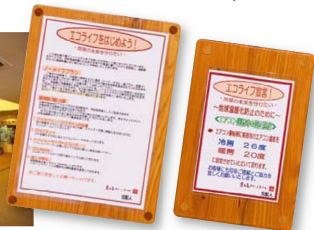
各客室に掲示している「エコライフ宣言」

屋久島グリーンホテルでは、照明設備の間引きや、点灯・消灯時間の管理を徹底しています。また、連泊客向けのノーマイクプランを推進するとともに、空調機器の温度設定などについて「エコライフ宣言」として掲示し、宿泊客に協力を呼びかけるなど、事業所が一体となって、できることから省エネルギー対策に取り組んでいます。