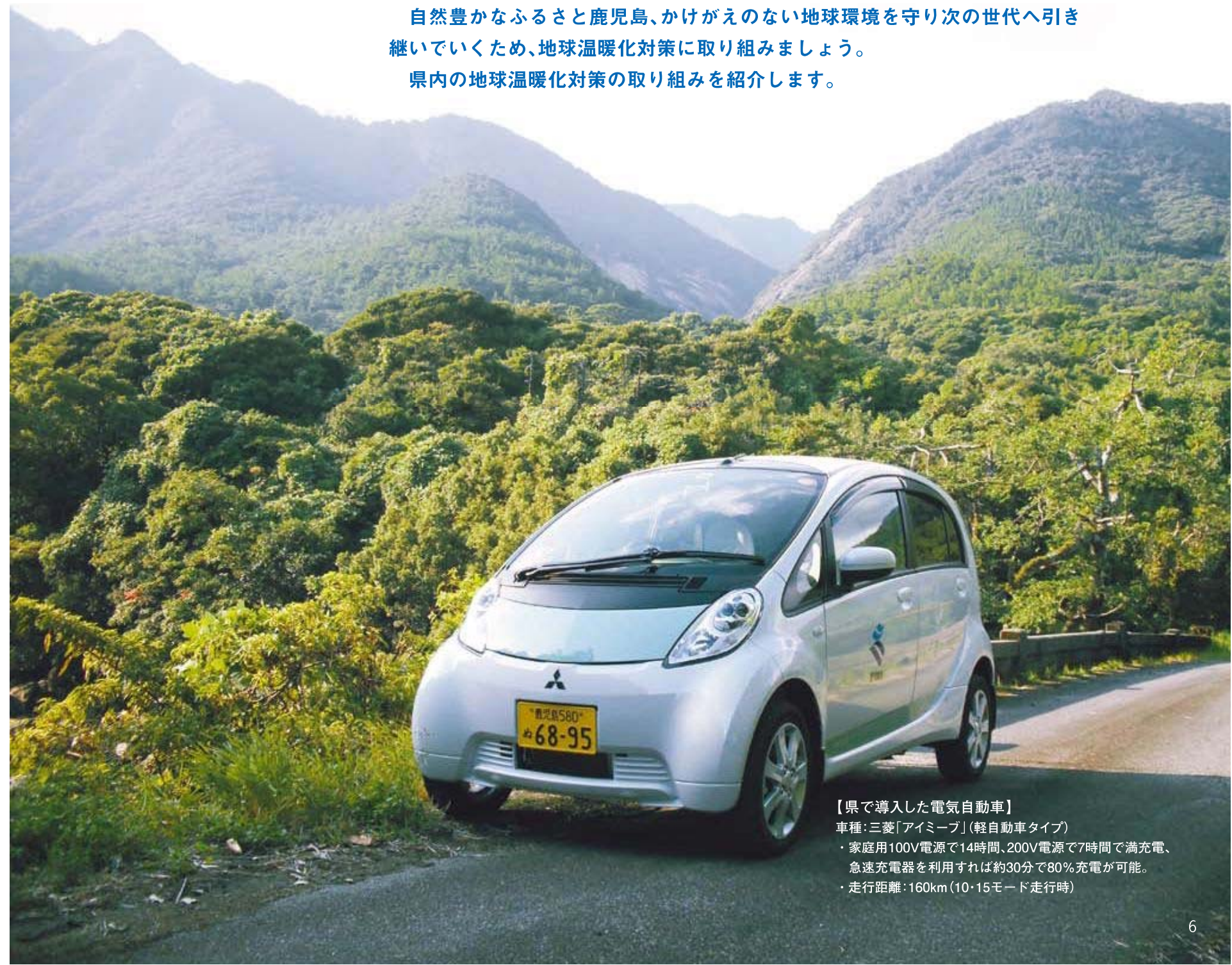
【県で導入した電気自動車】 車種：三菱「アイミーブ」(軽自動車タイプ) ・家庭用100V電源で14時間、200V電源で7時間で満充電、 急速充電器を利用すれば約30分で80%充電が可能。 ・走行距離：160km(10・15モード走行時)