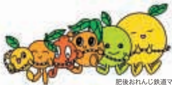
肥後おれんじ鉄道マスコット 「おれんじーず」