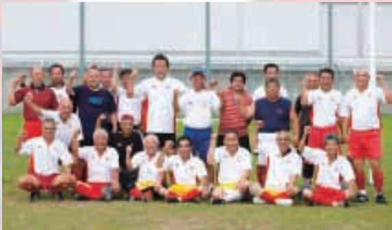
鹿児島感クラブ（鹿児島市）と宮之城感クラブ（さつま町）の皆さん。 年代によってパンツの色が異なり、黒紺50代（55歳以上）・赤60代・黄70代。