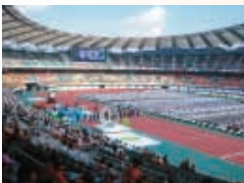
ねんりんピック静岡2006 総合開会式の様子

大会マスコット さくらまん 鹿児島県の雄大な桜島と参加者が明るくアピールしている元気な姿をデザインしています。