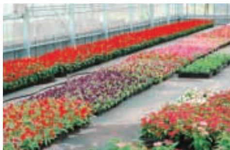
色とりどりの美しい花々が大切に育てられています

農業高校生として社会に出ても通用する人間になれるように、一生懸命に取り組んでいます。ねんりんピックにこのような形で参加することができて、嬉しいです。きれいな花を育てるために、こまめに除草するなど愛情を込めて管理をしています。心を込めて栽培したマリーゴールドやサルビアの花で、参加者の方々を温かく迎えたいと思います。今後、もっと多くの花を栽培して、鹿児島県を花いっぱいにしたいです。