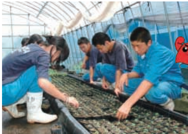
除草と生育にあわせた管理をみんなで一生懸命行っています

鹿屋農業高校の生物工学科3年生草花班の皆さんは、活動に参加して、たくさんのお花を育てています。