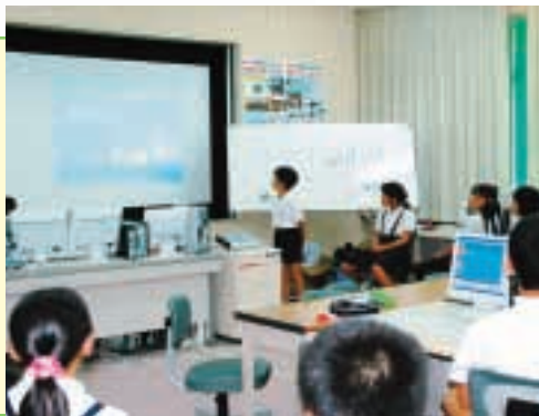
インターネットで調べた内容を発表し、みんなまで学習します

ねんりんピックについて調べていくと、いろいろな競技で広く交流されていることやペタングのルールも少し分かるようになりました。選手団の皆さんとペタングについて話をしたり、応援をしたり、さらに一緒にペタングを楽しめたらいいなど考えています。自分たちにできることを精一杯やりたいと思っています。10月が待ち遠しいです。