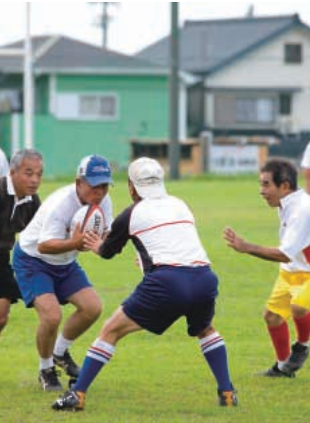
真剣にボールを追う中にも、笑顔や笑い声が絶えず生き生きとプレーを楽しんでいます。

出場予定の鹿児島市とさつま町の2チームの皆さんによる合同練習の様子です。フィールドを駆け抜ける軽快な走りや、力強い見事なボールパスなど、年齢を感じさせない素晴らしいプレーに注目です。