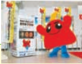
鹿児島空港に設置された カウンタダウンボード