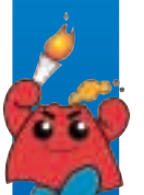
ねんりんピック 鹿児島 2008

ねんりんピック鹿児島2008では、全国から参加した人々を鹿児島県民の真心で、温かく迎えようと、子供や学生のボランティアなど県民の皆さんの協力により、大会をサポートし盛り上げていくためのさまざまな活動も展開中です。