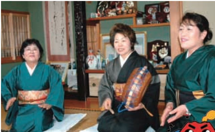
歌の出る席ではきまって最初に歌われる「朝花節」。裏声を多用した伸びやかな歌声と、三味線(さんしん)の奏でる繊細な響きが絡み合う島唄のリズムに、心地よく引き込まれていく。