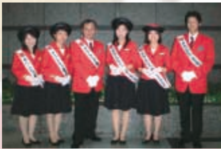
キャンペーンスタッフの皆さん

ねんりんピック鹿児島2008を県内外に広くPRするため、公募により選ばれた6名のキャンペーンスタッフが各種イベントへの参加、関係機関への表敬訪問などで活躍しています。 大会開催100日前となる7月17日(木)には、鹿児島空港において、開催までの残日数を表示するカウンタダウンボードの点灯式があり、シールやうちわなどを配布し、PRを行いました。ねんりんピックについて質問されるなど、多くの方々の関心の高まりを感じました。