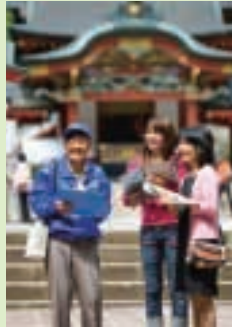
霧島しつちよいどん (霧島市)

小松帯刀らの薦めにより、霧島を訪れた坂本龍馬夫妻も参詣した霧島神宮。二人が歩いた旧参道なども残っている。観光ボランティアガイドの説明を聞きながら、当時の様子に想いを馳せる(関連8ページ)。