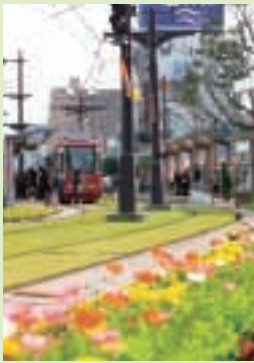
軌道敷緑化 (鹿児島市)

鹿児島中央駅から鹿児島駅まで、路面電車の軌道敷は緑になった。車道の上に敷かれた目にも優しい緑の芝生は、地表面の温度を下げたり、防音効果があるとされる。夜間はライトアップされ、昼とは違ったかごしまの顔をのぞかせる。