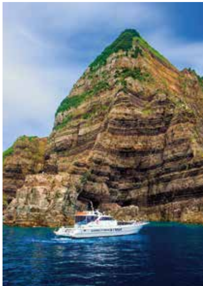
鹿島断崖 (下甑島・鹿島町)

クルーズ観光船でしか行く事のできない海食崖が16キロメートルにも渡って続いています。ほぼ垂直な断崖は圧巻の迫力で、人気の観光スポットになっています。