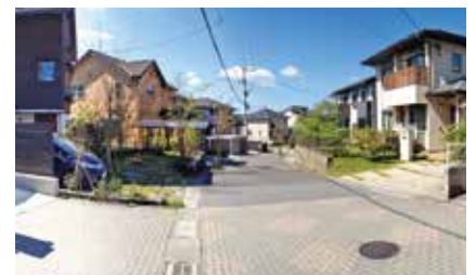
ガーデンヒルズ松陽台

県住宅供給公社では、県内4団地で宅地を分譲中です。住宅見学会やマイホームセミナーなども随時開催しています。