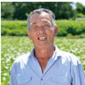
JA南さつまいも知覧支所知覧町園芸振興会さつまいも部会