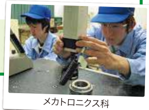
メカトロニクス科