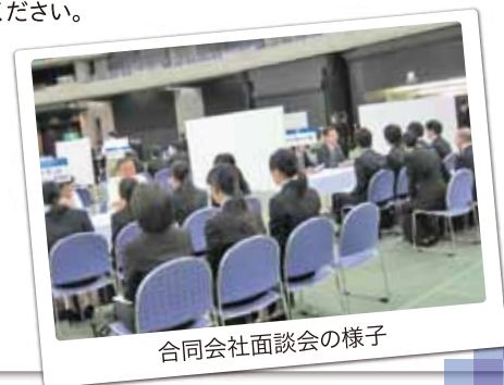
合同会社面談会の様子