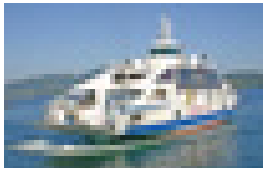
諸浦港～片側港～中田港(天草)を結ぶカーフェリー「フェリーロザリオ」

かたそば 片側港では、下あごの化石から実物大を想定して作られたクビナガリュウのモニュメントが迎えてくれます。